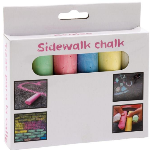
Art Nr. 0504006 Beschreibung: Straßenmalkreide in 6 verschiedenen Farben Farben: grün, blau, rot, gelb, weiß, lila Material: Kreide