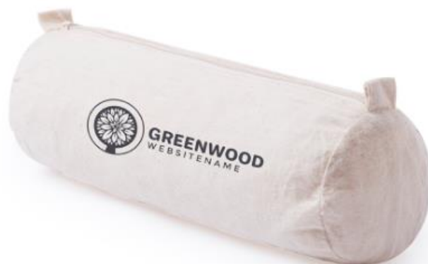
Art Nr. 6121 Beschreibung: Etui klassische Zylinderform mit Schlaufe und Reisverschluss Farben: Natur Material: 100 % Baumwolle