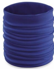
Art Nr. 5506 Beschreibung: Kinder-Nackenwärmer Farben: weiß, schwarz, rot, grün, gelb, orange, pink dunkelblau Material: weiche, elastische Polyester