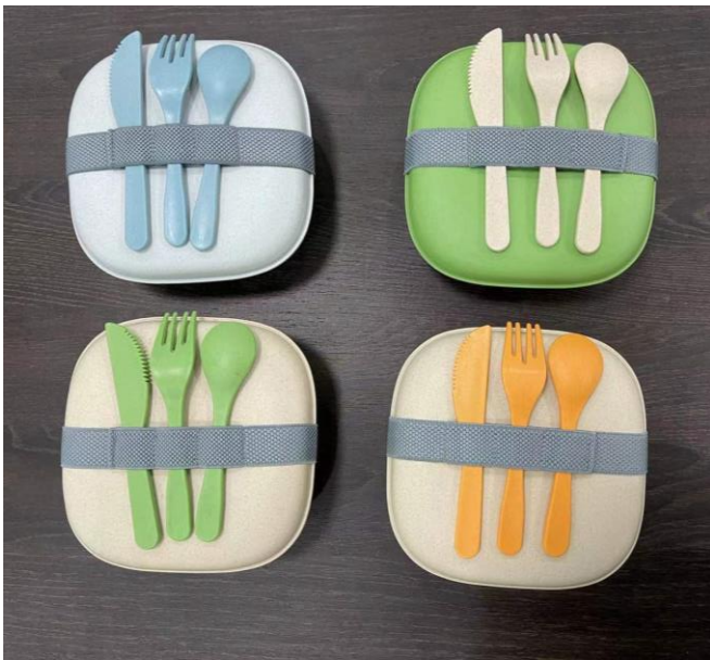
Art Nr. 52158 Beschreibung: Lunchbox mit Besteck Farben: blau, grün, Natur Material: Bambus