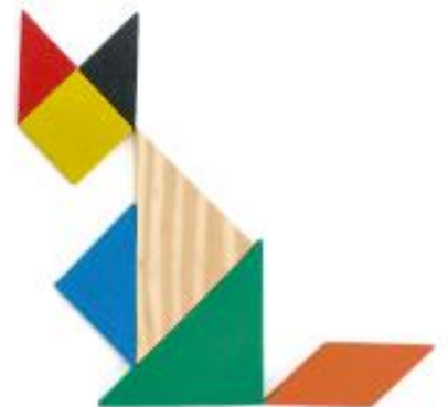
Art Nr. 3704 Beschreibung: Holzpuzzle mit bunten Teilen (7 Stück) Farben: Natur (blau, gelb, rot, orange, grün, schwarz) Material: Holz