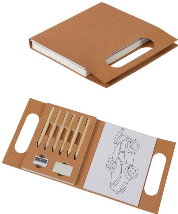
Art Nr. 0504116 Beschreibung: Malbuch mit 6 Stiften, 1 Spitzer, 1 Radiergummi in einer Papiertasche Farben: braun Material: Papier /Kunststoff