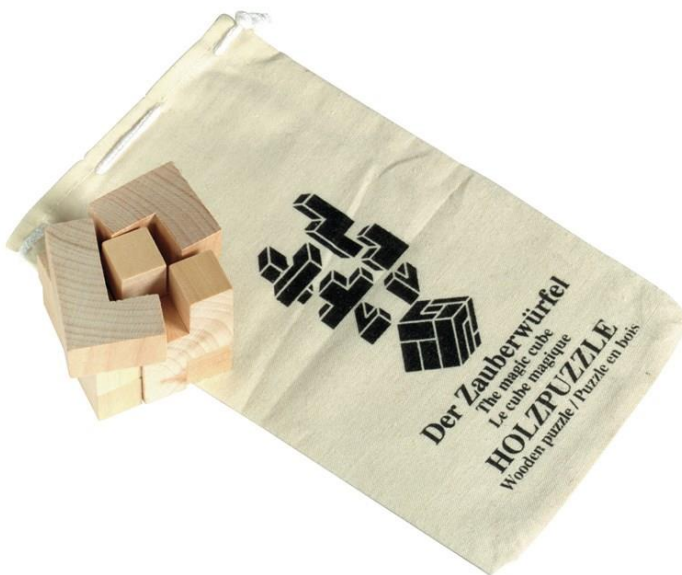
Art Nr. 050103 Beschreibung: Holz-Puzzle in einem Baumwollbeutel Farben: Natur Material: Holz