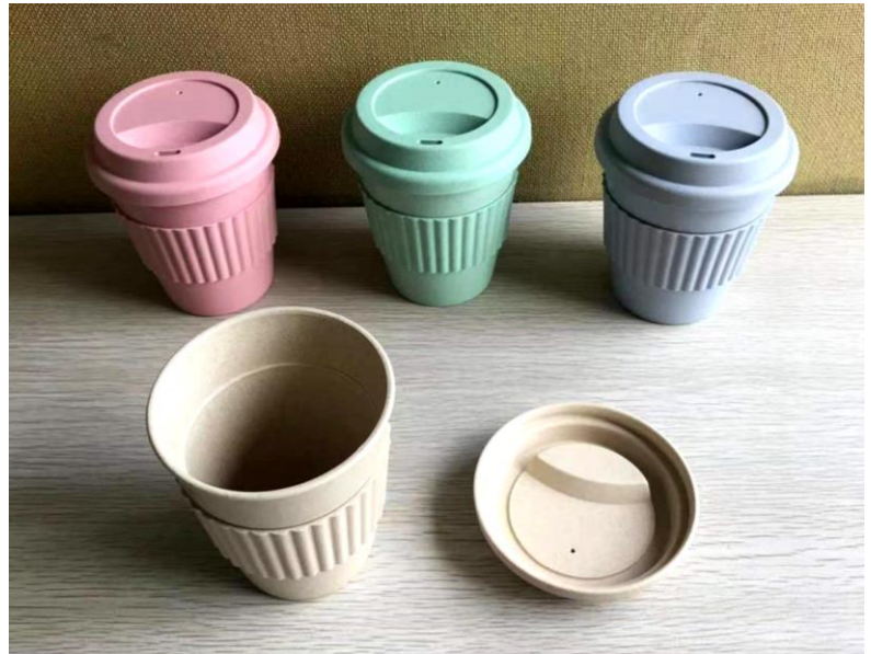
Art Nr. 5487 Beschreibung: Trinkbecher mit Deckel und Silikonmanschette für optimale Griffigkeit Material: Weizenstroh Füllvermögen: 350 ml