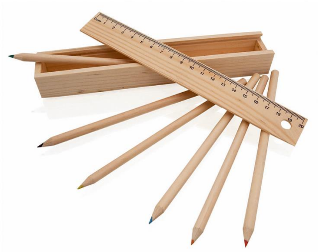
Art Nr. 3386 Beschreibung: Set aus 6 Stiften im Etui mit Deckel, 20 cm Lineal Farben: Natur Material: Holz