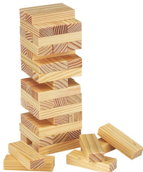
Art Nr. 051036 Beschreibung: Wackelturm Farben: Natur Material: Holz