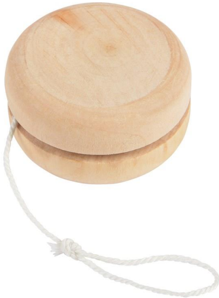
Art Nr. 050101 Beschreibung: Jo-Jo 5,3 x 2,8 cm Farben: Natur Material: Holz