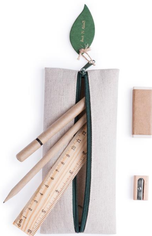
Art Nr. 6167 Beschreibung: Federmappe mit Reisverschluss und Blatt Farben: Natur Material: Jute und Baumwolle