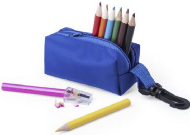
Art Nr. 5139 Beschreibung: Etui mit Reisverschluss Farben: blau, weiß, rot, grün, gelb Material: 420D Polyester