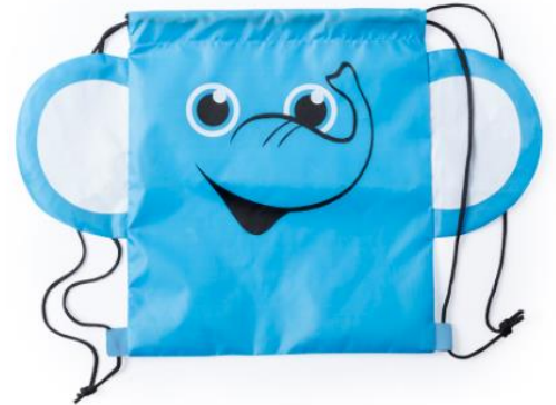
Art Nr. 5705 Beschreibung: Turnbeutel Frosch, Katze, Elefant Farben: Grün, Blau, Grau Material: weiches 210T Polyester