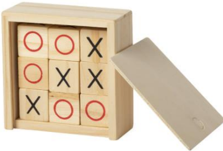
Art Nr. 6417 Beschreibung: Brettspiel in einer Holzkiste mit Schiebedeckel Farben: beige Material: Holz