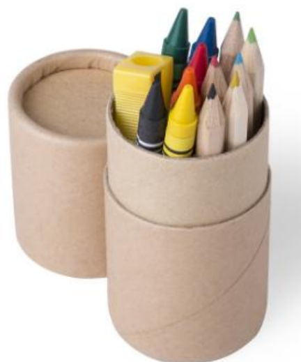
Art Nr. 3641 Beschreibung: 13-teiliges Set in zylinderförmigem Etui Farben: Natur Material: Karton