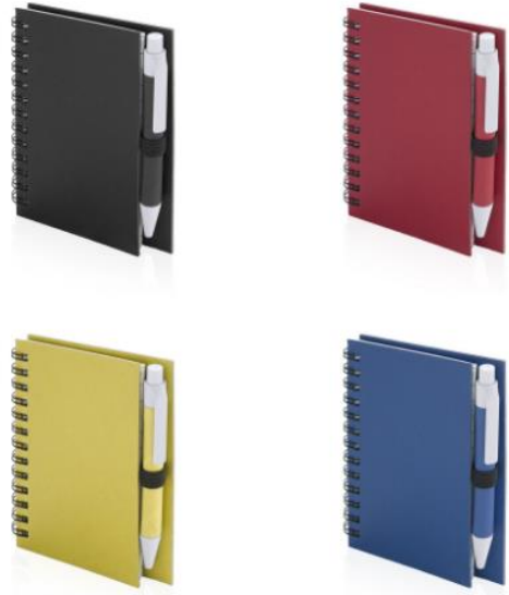
Art Nr. 4670 Beschreibung: Ring-Notizbuch mit Soft-Cover Farben: schwarz, rot, grün, gelb, blau Material: resistentem Recyclingkarton